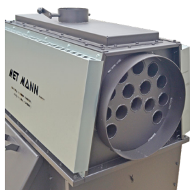
Intercambiador de calor de alto rendimiento Heating exchanger of high performance Échangeur de chaleur d' haut rendement