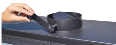
Regulador de tiro a la salida de humos Chimney flue regulation on the smokes exit Régulateur du tirage à la sortie des fumées