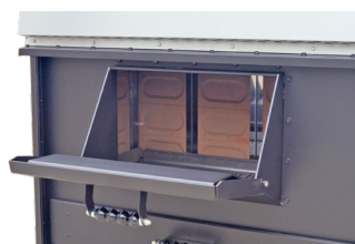
Amplio hogar de combustión Big combustion chamber Grande chambre de combustion