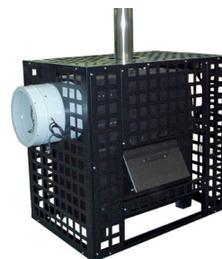
Jaula de protección Protection cage Cage de prévention