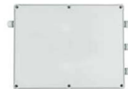
MULTI 6 (MULTI CONEXIÓN)

COMFORT TR-110L-2: Interruptor ON/OFF - Termostato de 5-35°C - 3 velocidades - Heat/Fan/Cool