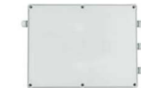
MULTI 6 (MULTI CONEXIÓN)

COMFORT TR-110L-2: Interruptor ON/OFF - Termostato de 5-35°C - 3 velocidades - Heat/Fan/Cool