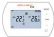
INTELLIGENT PANEL RL309 WIFI